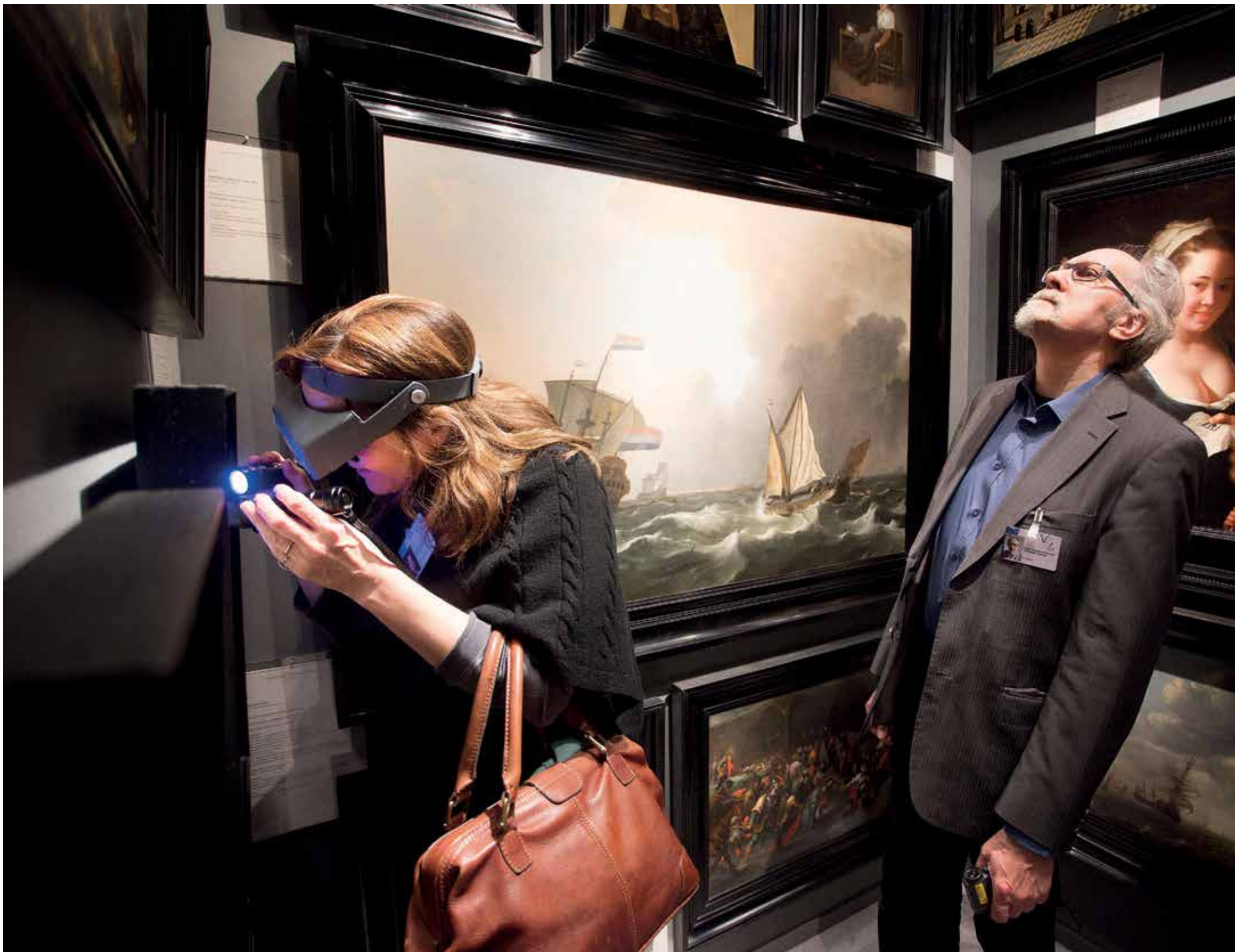
Daags voor de Tefaf keuren experts de schilderijen

één discipline beantwoord kunnen worden. Het nieuwe Maastricht Centre for Arts and Culture, Conservation and Heritage, kortweg MACCH, speelt hier op in. Onderzoekers van vier Maastrichtse faculteiten (rechten,