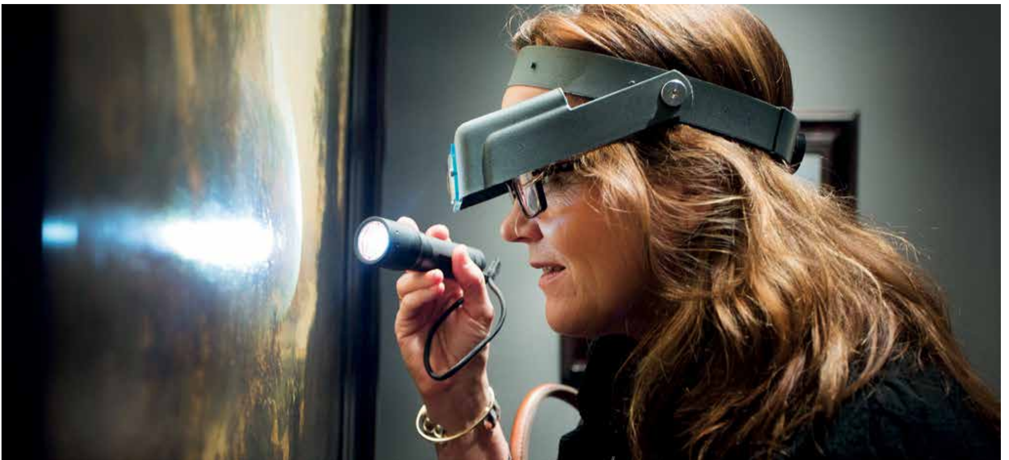
Is het echt of hebben we te maken met namaak? Alle objecten en schilderijen op de Tefaf (13-22 maart) worden vooraf onderworpen aan een zeer strenge inspectie. Zie pagina 8-9.

Onafhankelijk weekblad van de Universiteit Maastricht | Redactieadres: Postbus 616 6200 MD Maastricht | Jaargang 35 | 12 maart 2015