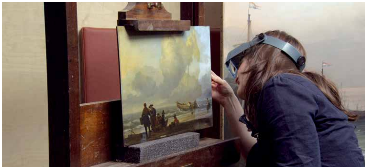
Still uit National Gallery

beeld over het gebruik van röntgentechnologie in de restauratie van Rembrandts Ruiterportret van Frederick Rihel – die al die eeuwenoude kunst tot leven brengen.