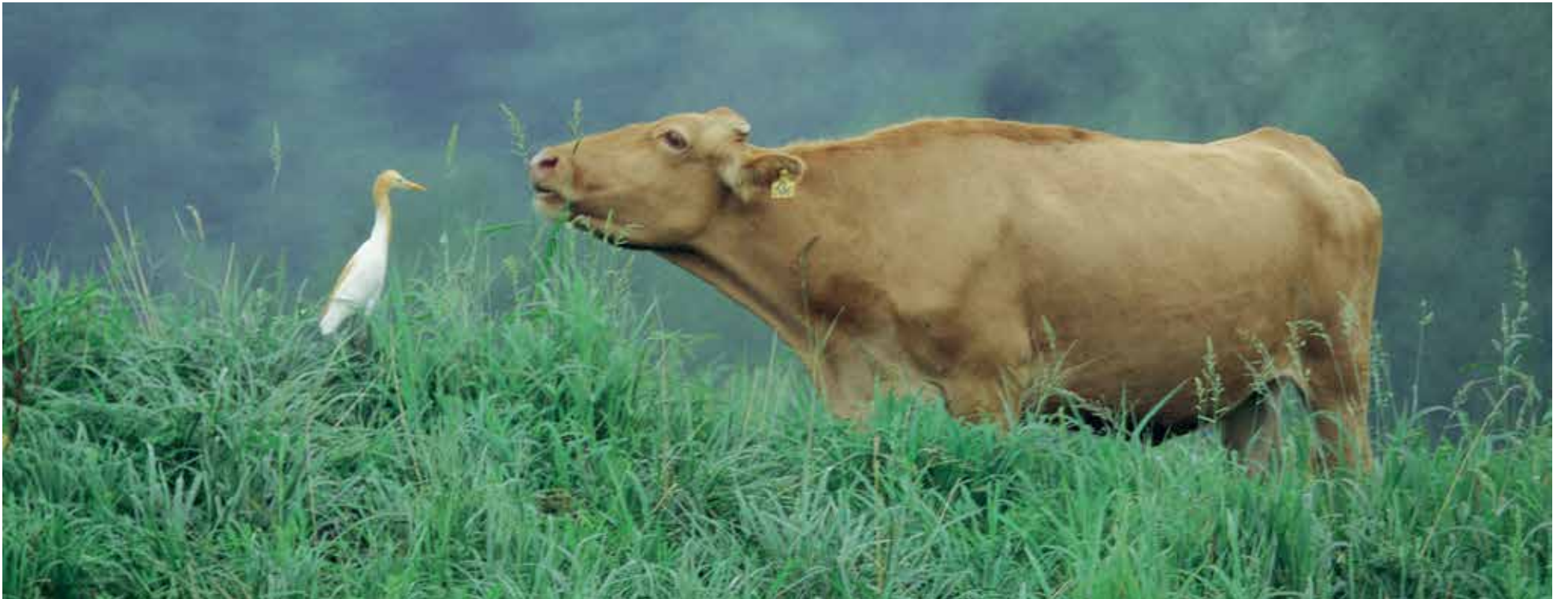
En een vogel en een koe: allebei opgebouwd uit 25 duizend eiwitten