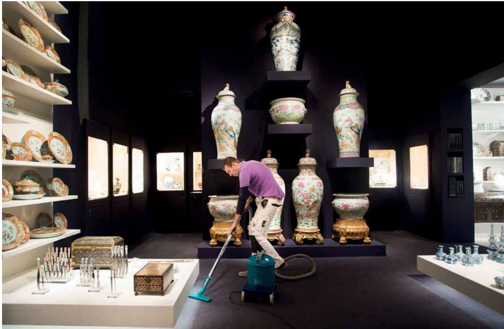
Alles in gereedheid brengen voor de opening aanstaande vrijdag