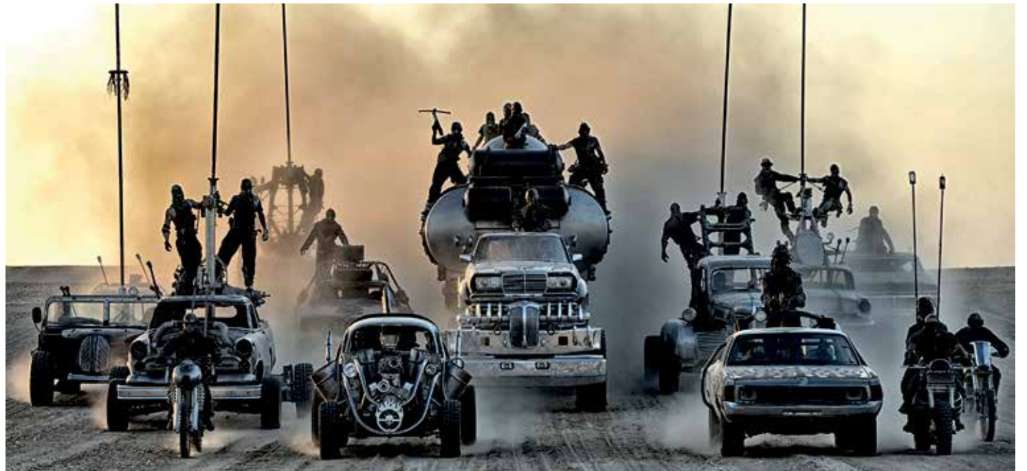
Still uit Mad Max: Fury Road

Max? Het blijkt een actiefilm waarin vrouwen het enige lichtpunt zijn in een door sadistische kerels verziekte planeet. Dat de War Boys enige gelijkenissen vertonen met de martelaren van de islam, lijkt me geen toeval.