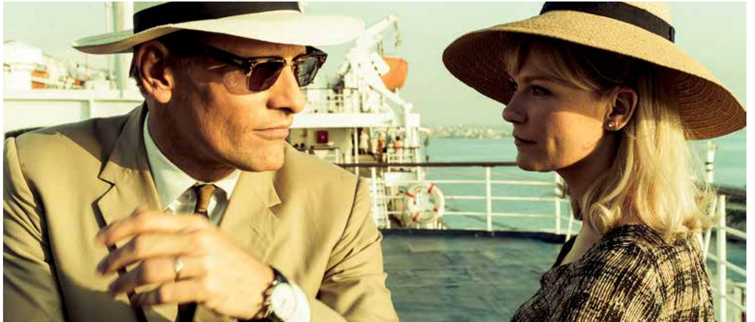
Still uit The Two Faces Of January

- Hossein Amini maakt met deze film de overstap van scenarist naar regisseur, maar zijn oude stijl blijft zichtbaar in de wijze waarop hij de mythe van Theseus (plus wat oedipale kwesties) in zijn scenario weet te vlechten.