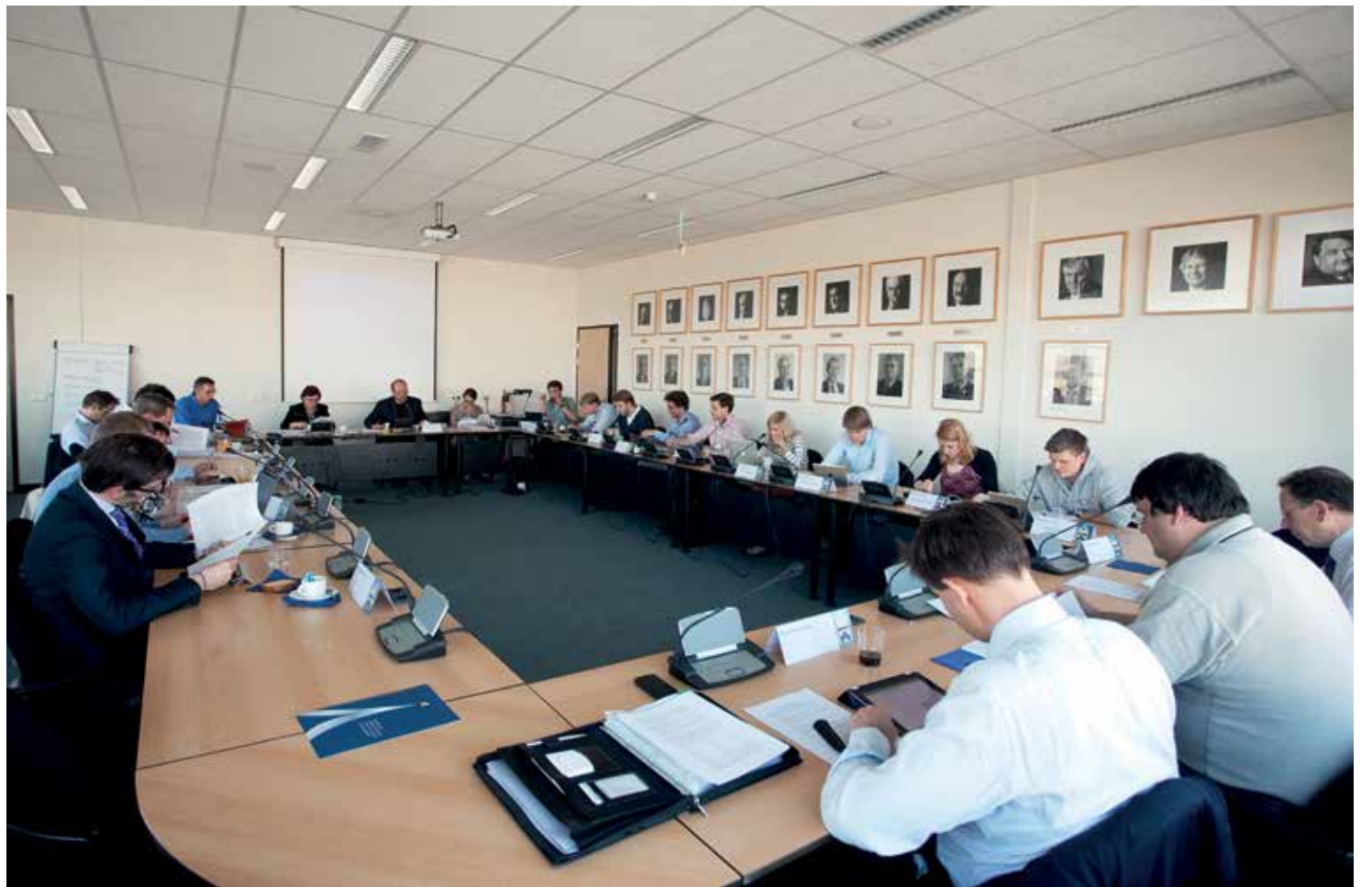
De Maastrichtse universiteitsraad in 2013

stukken 9 en 10, waar de instemmings- en adviesrechten van universiteits- en hogeschoolraden in zijn opgenoemd: "Die lijstjes zijn bewust niet limitatief, het zijn minimumrechten. Het is een mythe dat je niet verder zou mogen gaan dan dat. Een raad met meer lef had het budgetrecht kunnen behouden, zeker in de periode dat het regime wijzigde. Bij de universiteiten is het overal verloren gegaan, veel hogescholen hebben het nog."