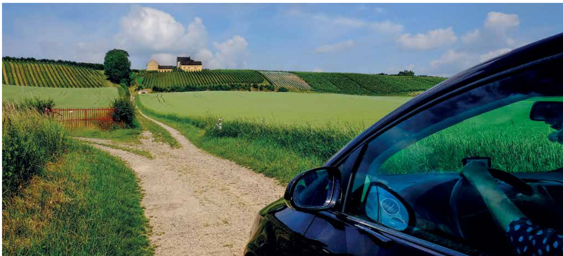
We wish you all a nice and relaxed summer

Onafhankelijk weekblad van de Universiteit Maastricht | Redactieadres: Postbus 616 6200 MD Maastricht | Jaargang 34 | 19 juni 2014