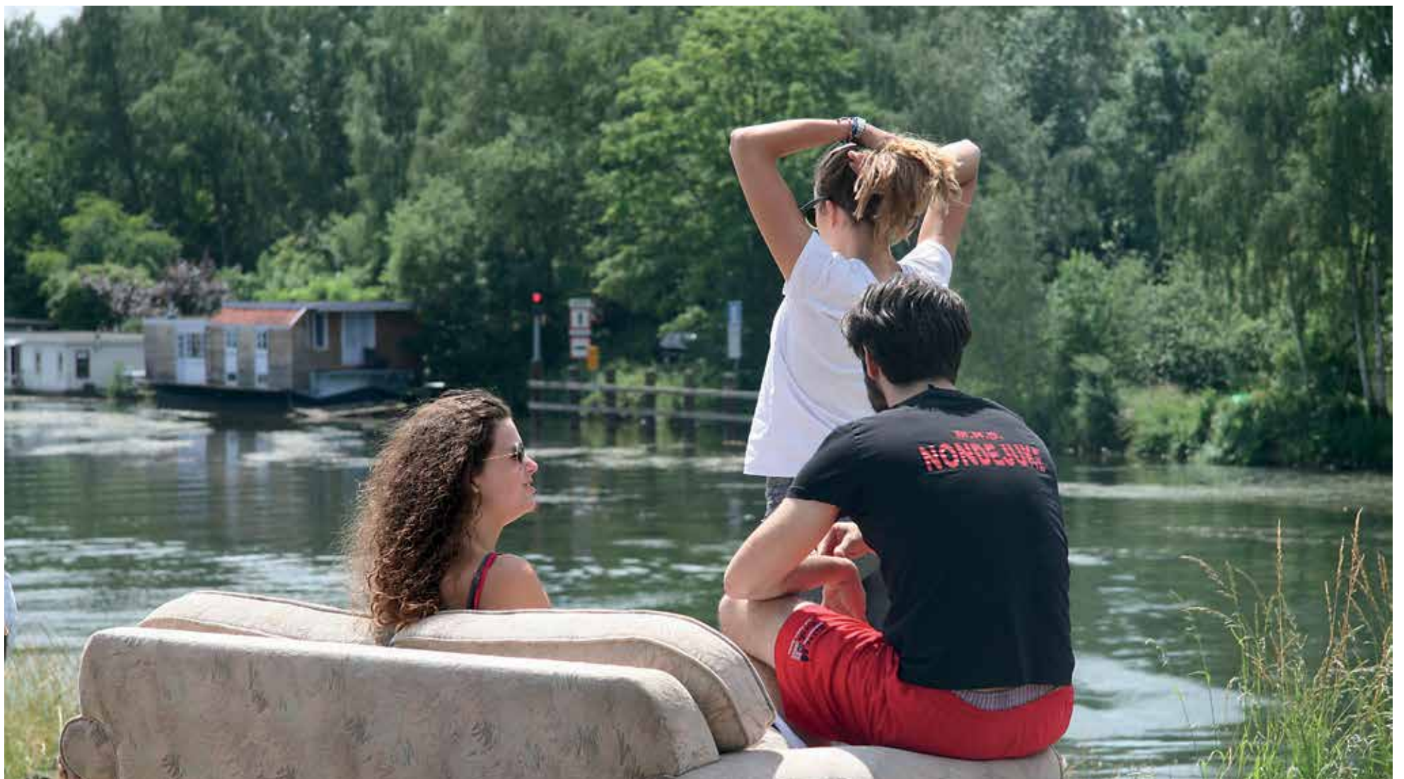
We wish you all a nice and relaxed summer. Fijne vakantie!

Onafhankelijk weekblad van de Universiteit Maastricht | Redactieadres: Postbus 616 6200 MD Maastricht | Jaargang 35 | 18 juni 2015