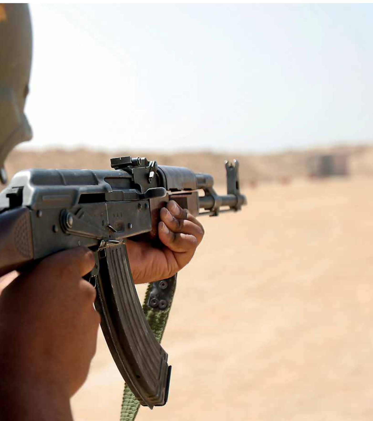
Sinds een aantal jaren melden verdacht veel Amerikaanse veteranen posttraumatische stressklachten

de civiele kwesties, schat men. Inmiddels weten we dat het ook in Nederland vaker voorkomt dan we dachten. Iedereen doet het, man, vrouw, oud, jong, arm en rijk. Je ziet geen duidelijke verschillen.”