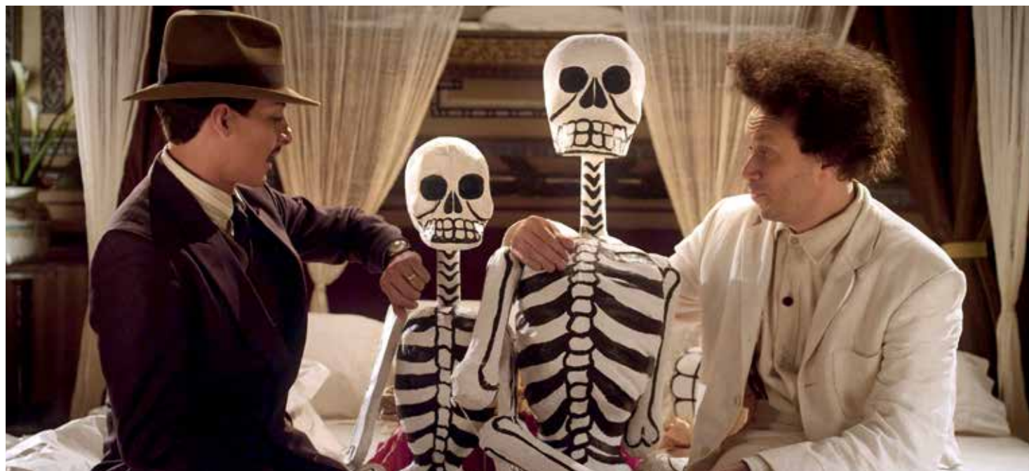
Still uit Eisenstein in Guanajuato

nodige op af te dingen, maar het blijft verfrissend dat er nog filmmakers zijn die tegen het grauwe realisme ingaan dat de filmtheaters tegenwoordig domineert.